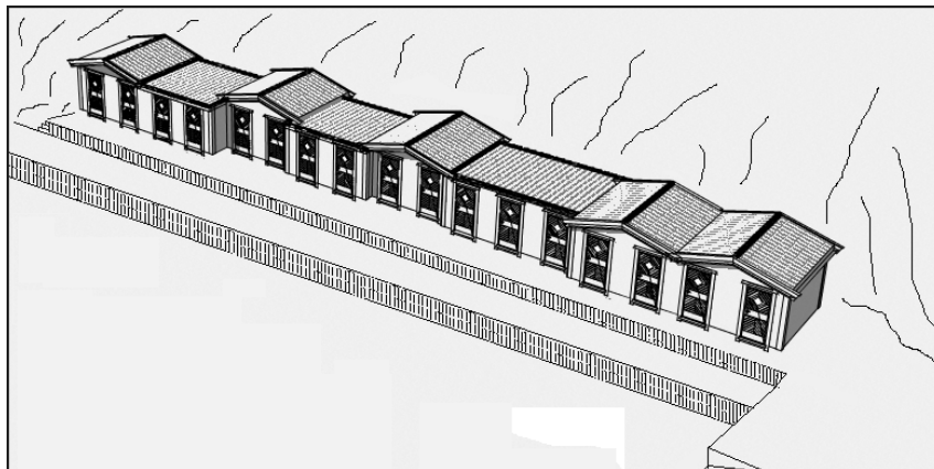
Enkel prinsippskisse for utstyrsboder i marina.

Område for næring (utleige) er vist innanfor område som på kommuneplanen er vist som område for fritidsbustader. Bruken samsvar såleis med arealbruken i kommuneplanen.